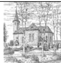
St. Antonius Denklingen

Bitte beachten Sie die geänderte Gottesdienstordnung in den Sommerferien: Die Sonntagabendmessen in Ziegenhardt und Schönenbach entfallen!