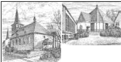
St. Michael Waldbröl

Beiträge für die Pfarrmitteilungen vom Samstag 24.08.2019 bis Sonntag 01.09.2019 (Nr.: 35/2019) senden Sie bitte per Mail bis Donnerstag, den 15.08.2019 an die Pfarrbüros oder geben Sie sie dort ab.