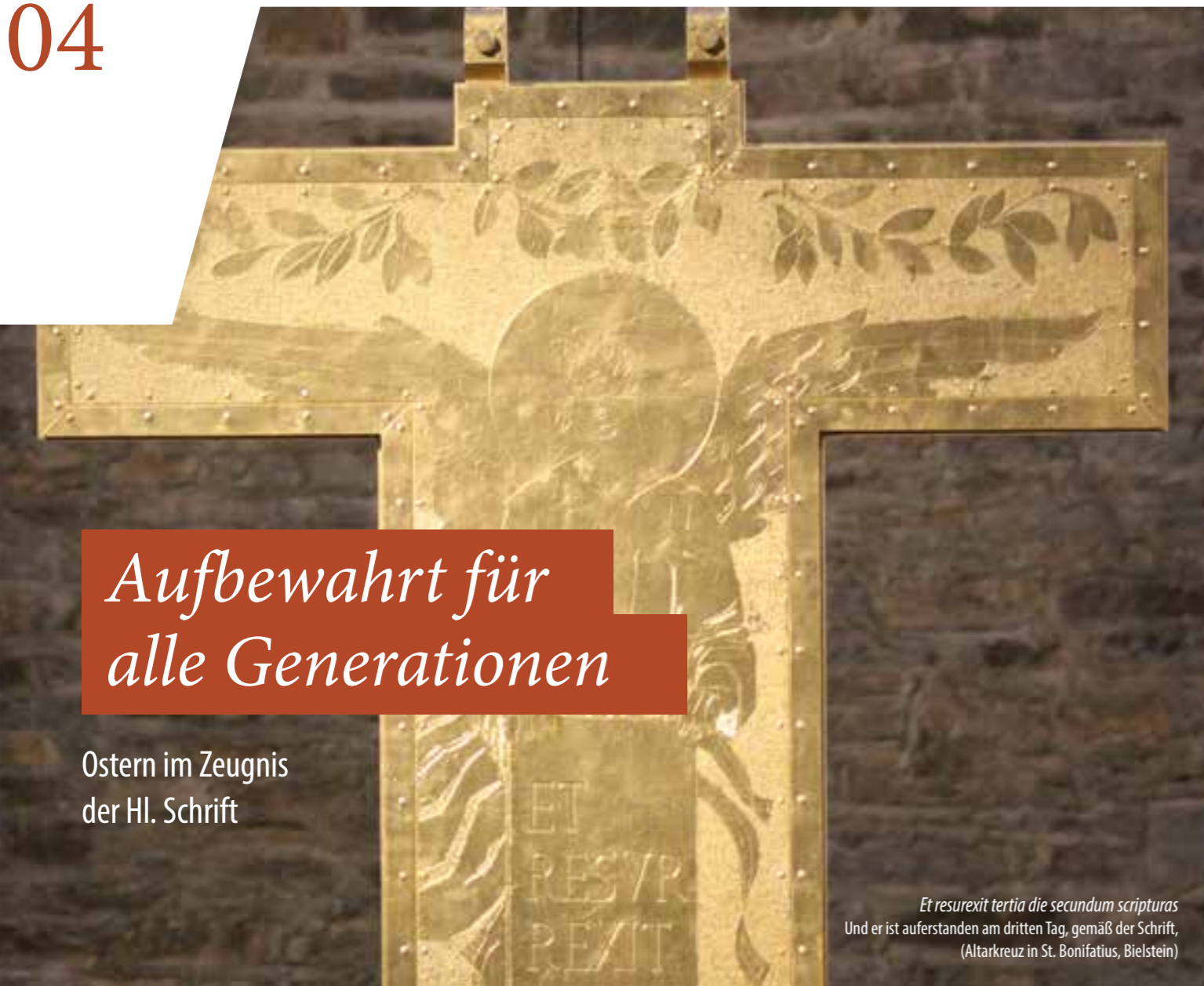
Et resurrexit tertia die secundum scripturas Und er ist auferstanden am dritten Tag, gemäß der Schrift, (Altarkreuz in St. Bonifatius, Bielstein)

»Wir müssen es aufschreiben, um es für alle Generationen zu bewahren!«. Das war nicht das Erste, was den Schülerinnen und Schülern Jesu, die vom Ostergeschehen ergriffen wurden, auf der Seele brannte. Denn spätere Generationen lagen gar nicht in ihrem Blickfeld. Sie waren vielmehr davon überzeugt, dass jetzt, wo ihr Herr nach dem grausamen Tod wieder lebte, keine lange Zeit vergehen würde, bis er »wiederkommt in Herrlichkeit«. Dann würde die sichtbare und zweifelsfrei erlebbare Gegenwart Jesu Christi für alle selbstverständlich sein. Heute nennt man diese Überzeugung »die Nah-Erwartung der ersten Christen«.