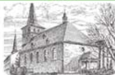
St. Michael Waldbröl