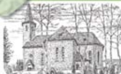
St. Antonius Denklingen