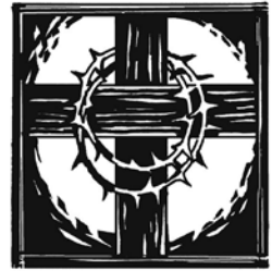
Karfreitag „Es ist vollbracht.“