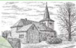
St. Konrad Ziegenhardt