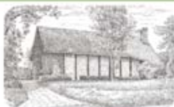
Zur Hl. Familie Feld