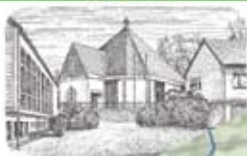
Hl. Geist Nümbrecht