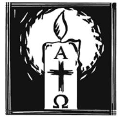
Ostersonntag „Er ist wahrhaft auferstanden.“