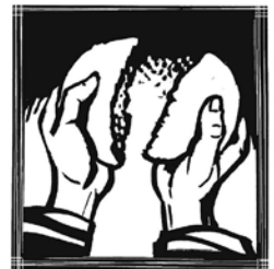
Ostermontag „Brannte uns nicht das Herz?“