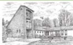
St. Mariä Himmelfahrt Wiehl