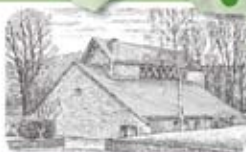
St. Bonifatius Bielstein