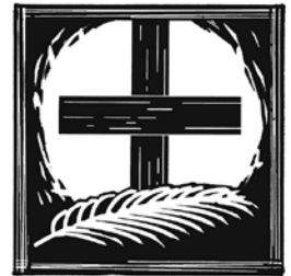
Palmsonntag „Gelobt sei, der da kommt ...“

Liturgie vom Palmsonntag in St. Bonifatius mit Palmweihe im Pfarrsaal und kleiner Prozession